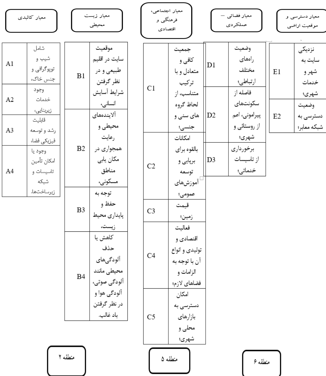
شکل ۲. ساختار تاپسیس فازی