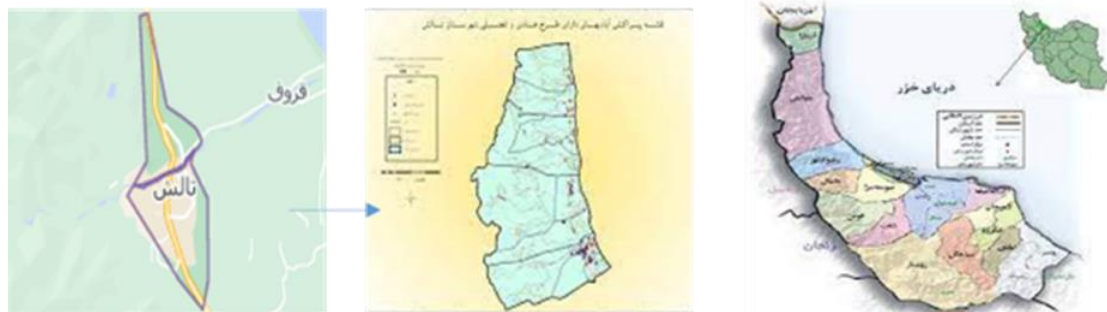
شکل ۲ نقشه ی شهر تالش