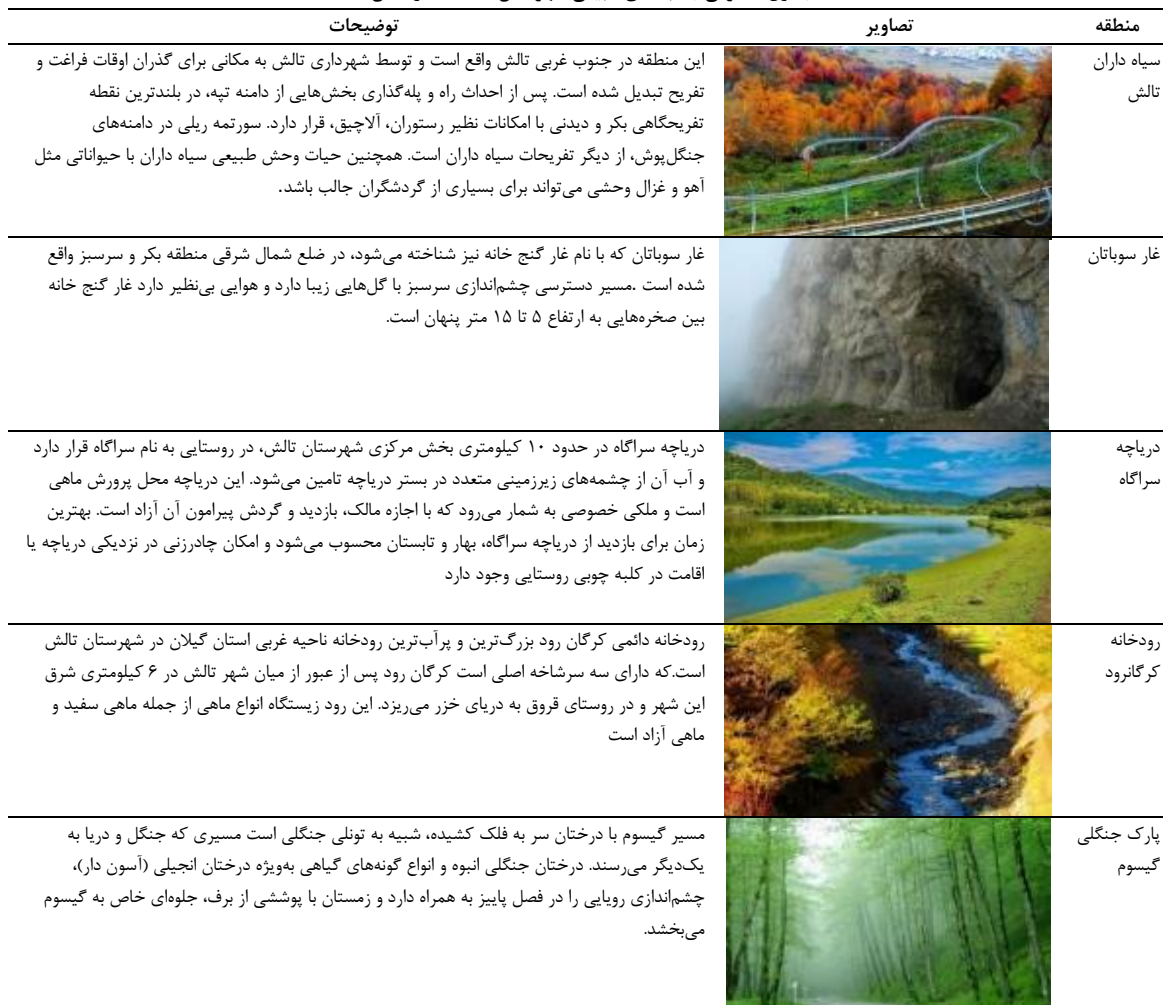
جدول ۱ معرفی جاذبه های طبیعی شهر تالش، ماخذ: نگارندگان

سطح زندگی مردم محلی و حفظ محیط زیست شود. جاذبه های گردشگری در راستای اکوتوریسم را میتوان در محیط طبیعی و مصنوع در گروه های زیر دسته بندی کرد: جاذبه های منابع های طبیعی: جنگل، دریا، کوهستان، رودخانه، جاذبه های علمی و پژوهشی: یادمان ها، مطالعات طبیعت، موزه علمی جاذبه های ورزشی و تفریحی: ، دریاوردی، اسکی، شنا، کوهنوردی، دوچرخه سواری، پیاده روی جاذبه های اجتماعی و فرهنگی: مردم شناسی، نمایشگاه ها، جشنواره ها، مراکز هنری جاذبه های درمانی و بهداشتی: آب های معدنی، نور آفتاب، هوای سالم جاذبه های طبیعت گردی : صحرانوردی، غارپیمایی، دریاگردی، جنگل گردی، جاذبه های سیر و سیاحت: زیارت، بازدید آثار تاریخی، بازدید جوامع، پیک نیک و اردو جاذبه های آموزشی و پژوهشی: آموزش جغرافیا، گیاه شناسی، مردم شناسی جاذبه های طبیعی: تالش از سه جهت به کوه های تالش (ادامه رشته کوه های البرز) و از طرف دیگر به دریای خزر منتهی شده است. جاذبه های طبیعی این شهرستان هر ساله تعداد بسیاری از گردشگران را به سوی خود می کشاند. شهرستان تالش با توجه به موقعیت جغرافیایی خاص از یک سو به جلگه، شهر و دریا و از سوی دیگر به کوهپایه های جنگلی محدود می شود. تالش جاذبه های گردشگری بسیاری دارد.