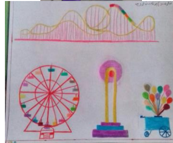
شکل ۱ الگوی فضای باز در نقاشی کودکان

شکل (۲) بدلیل عدم وجود وسایل بازی مناسب در این پارک، آنها انتظارات خود از زمین بازی را وجود وسایل بازی سنتی اعم از تاب، چرخ و فلک، سرسره و فضای سبز نقاشی کرده اند. همانطور که ملاحظه می شود، انتظارات کودکان از این پارک بسیار پایین می باشد.