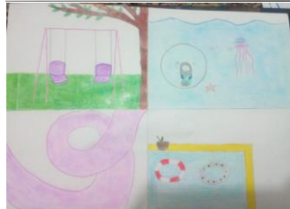
شکل ۳ انتظارات کودکان از زمین بازی ایده آل

بازی ایده آل آنان را مطرح ساخته و در نتیجه بیشترین میزان فصل مشترک را میان نظرات کودکان داشته باشیم. در این فرآیند و براساس تحلیل های نقاشی های کودکان، نتایج زیر قابل برداشت است: