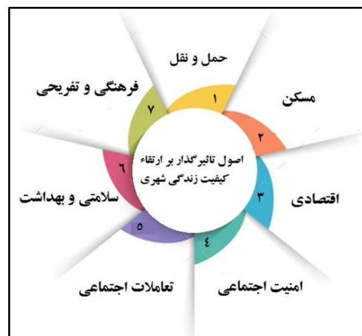
شکل ۳ اصول تاثیرگذار بر ارتقا کیفیت زندگی شهری در شهر دوستدار سالمند: منبع نگارندگان

به منظور ایجاد احساس امنیت و آسایش سالمندان باید فضاهای بی دفاع و ناامن نیز شناسایی شود و با بهره گیری از اصول و ضوابط به افزایش امنیت در آن فضاها پرداخته شود تا باعث ایجاد رعب و وحشت در سالمندان نشود. به طور کلی می توان گفت که اصول تاثیرگذار بر ارتقا کیفیت زندگی شهری در شهر دوستدار سالمند به شرح زیر است: