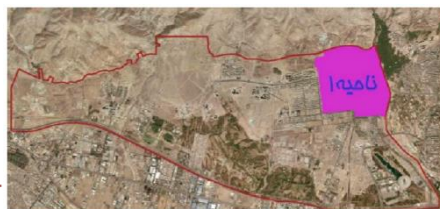
شکل ۴: موقعیت ناحیه ۱ منطقه ۲۲ تهران