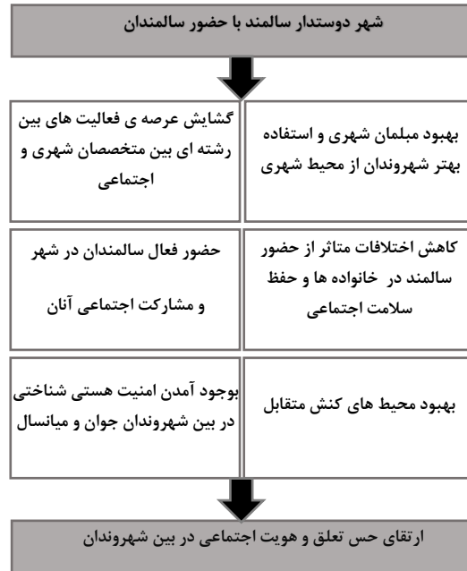
شکل ۱ مولفه های شکل دهنده به شهر دوستدار سالمند؛ [۳]

های گسترده ای برای مشارکت آن ها در جامعه در نظر گرفته شود . سازمان بهداشتی جهانی برای ایجاد تعامل و کمک به شهر ها به منظور مناسب تر شدن شهر ها برای سالمندان حوزه های شهر دوستدار سالمند را در شکل ۲ بیان کرده است.