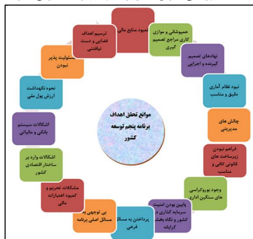
شکل ۲ همپوشانی و موانع تحقق برنامه پنجم توسعه عمرانی کشور

مصطفی پورمحمدی مسئولیت پذیر نبودن را مانع تحقق کامل برنامه پنجم توسعه دانسته و اظهارداشته است: نیاستی مدل های پیشرفته ای ارائه کنیم که دست نیافتنی و فضایی باشند بلکه با توجه به ظرفیت ها و پتانسیل موجود جامعه خود برنامه ریزی و هماهنگ باشد. بررسی عملکرد دستگاه های اجرایی در حوزه پژوهش، فناوری و نوآوری در برنامه پنجم توسعه نشان می دهد که اجرای اکثر احکام برنامه پنجم با موانع متعددی روبرو است و به همین دلیل پیشرفت قابل توجهی نداشته است. در کل، از مهمترین دلایل عدم تحقق کامل احکام مربوط به پژوهش، فناوری و نوآوری در برنامه پنجم، می توان به کمبود منابع مالی، تعدد، همپوشانی و موازی کاری مراجع تصمیم گیری، تعامل ضعیف نهادهای تصمیم گیرنده و اجرایی، نبود نظام آماری دقیق و مناسب، چالش های مدیریتی، فراهم نبودن زیرساخت های قانونی کافی و مناسب، وجود بوروکراسی های سنگین اداری، پایین بودن امنیت سرمایه گذاری در کشور و نگاه بخشی گرایانه اشاره کرد.