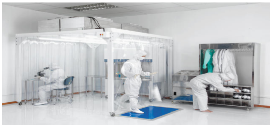
تصویر (۲) استفاده از پرده هوا در اتاق تمیز [۱]

پرده هوا در اتاق تمیز: پرده هوای یک جریان نازک دایمی هوا است که در سطح درب ارتباطی فضای دارای تهویه مطبوع هوا را سیرکوله می کند. این پرده هوا از نفوذ هوای خارج با شرایط نامطبوع به داخل به وسیله ایجاد یک لایه جریان هوای اجباری روی تمام دهانه درب که سرعت و ضخامت لایه با توجه به شرایط درب تعیین می شود جلوگیری می کند [۱].