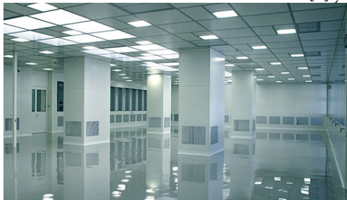
تصویر (۴) پوشش دیوار، کف و سقف

پلاستر برد به همراه پوشش رنگ می تواند گزینه مناسب و به صرفه ای باشد و طیفی از پوشش ها قابل استفاده هستند از جمله رنگ امولسیون، رنگ اپوکسی، پوشش (جی.آر.پی)، یا وینیل. از جمله معایب بسیار مهم نیاز به دسترسی از طریق پانل ها برای رسیدن به دریچه های HVAC است. صفحات فلزی مشبک دسترسی مناسبی برای تعمیر و نگهداری در سقف را ایجاد می کنند اما در صورت وجود فشار مثبت در اتاق تمیز نیاز به درزبندی دارند. در مجموع صفحات پلاستر برد با پوشش بی.وی. سی به صورت مشبک راه حل مقرون به صرفه دیگری است و سهولت دسترسی به سقف برای تعمیر و نگهداری را نیز فراهم می کند. اما این مورد نیز در صورت وجود فشار مثبت یا منفی در اتاق تمیز نیاز به درزبندی دارد [۵].