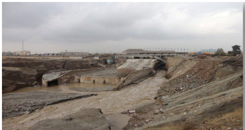
عکس (۳) : نمایی از تخریب کوله شرقی پل فتح در سیلاب آبان ماه ۱۳۹۱ (مهندسین مشاور سازه پردازی ایران - مردادماه ۱۳۹۲)