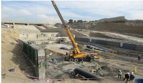
عکس (۱) : نمایی از انجام کارهای انجام شده در مسیر غربی طرح حفاظت اضطراری در رودخانه کن ، آذرماه

به لحاظ طراحی و امان سرعت اجرا شاید نمونه تکی باشد اما به لحاظ لفظ حفاظت و ساماندهی شاید بتوان طرح سامان دهی و بهسازی کن در محل تقاطع با اتوبان تهران - کرج را ( مهندسین مشاور ری آب ، اسفند ماه ۱۳۹۳ ) نمونه ای به لحاظ عملکرد سازه هیدرولیکی مشابه دانست که در ایران - تهران - در حال اجرا میباشد . اما در مقاله حاضر استراتژی مدیریت طراحی ، ساخت و نظارت طرح اضطراری حفاظت رودخانه کن در بازه شماره ۱ مورد بررسی و ارائه شده است