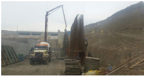
عکس (۲) : نمایی از انجام کارهای انجام شده در مسیر شرقی طرح حفاظت اضطراری در رودخانه کن ، اسفندماه ۱۳۹۵